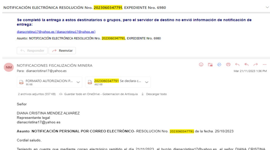
Imagen 2. Tomada del expediente digital HHJP-32

En segundo lugar, el acto administrativo en cuestión sí fue enviado al correo electrónico autorizado por la titular minera, contrario a lo que aduce su apoderada. Efectivamente, el 09 de noviembre de 2023 se envió la citación para notificación personal y el formato de autorización de notificaciones electrónicas, sin embargo, como se mostró anteriormente, dicho formato ya había sido suscrito con anterioridad. Así las cosas, la Gobernación de Antioquia remitió otro correo electrónico el 21 de noviembre de 2023, notificando la Resolución que se solicita revocar, y adicionalmente, se certificó la entrega del correo electrónico como se muestra a continuación: